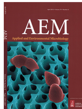
Saarbrücker cover der „Applied and Environmental Microbiology“ (79,8): Bakterien auf Nano-Abstandsstrukturen

beobachtet wird. So hat man festgestellt, dass Bakterien wesentlich langsamer absterben, wenn der direkte Kontakt zur metallischen Kupferoberfläche durch Nano-Abstandshalter unterbunden wird. Dies ist überraschend, da man bisher davon ausging, dass nur die Menge der aus dem Metall gelösten Kupferionen für das Abtötungsverhalten entscheidend ist. Gemeinsam mit dem Deutschen Zentrum für Luft und Raumfahrt wollen die Saarbrücker Wissenschaftler in einem bei der ESA beantragten Projekt nun auch erforschen, ob Kupferwerkstoffe zur Bekämpfung von gefährlichen Biofilmen in isolierten Raumstationen eingesetzt werden können.