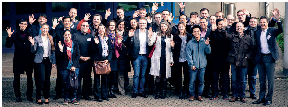
Ehemalige und aktuelle Mitarbeiter des Instituts