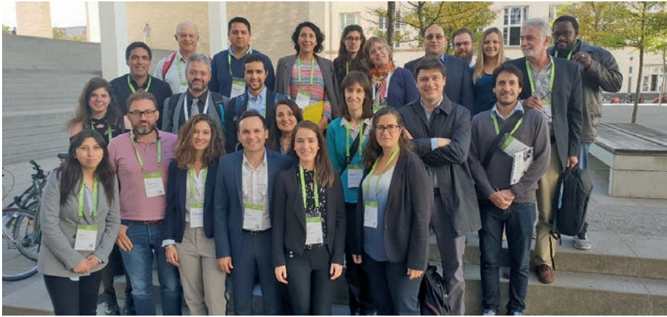
Treffen der CREATE-Projektpartner beim Abschlusstreffen im Rahmen der MSE2018 in Darmstadt. Meeting of the CREATE project partners at the final meeting during the MSE2018 in Darmstadt.

Verbundwerkstoffe, welche zu ressourceneffizienten Anwendungen und umweltfreundliche Technologien, wie zum Beispiel in Energiespeichern und elektrischen Kontakten, beitragen. Im Rahmen des Projekts wurden etwa 120 Austausche unter Beteiligung von 47 Wissenschaftlern mit unterschiedlichem Bildungsgrad (von Doktoranden bis hin zu Professoren) seit März 2015 durchgeführt, die zu 37 peer-reviewed Artikeln führten. Die Mittel (508.500 €) wurden aus dem Forschungs- und Innovationsprogramm Horizon 2020 der Europäischen Union im Rahmen der Finanzhilfvereinbarung Nr. 644013 bereitgestellt (Program RISE).