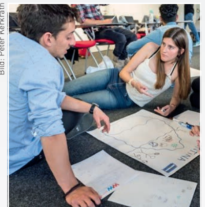
AMASE-Studenten beim Workshop während der Professional Summer School. AMASE-students at the workshop during the Professional Summer School.

Forum Praktische Metallographie Die Neue Plattform für Informationen, Austausch und Diskussion rund um das Thema Metallographie