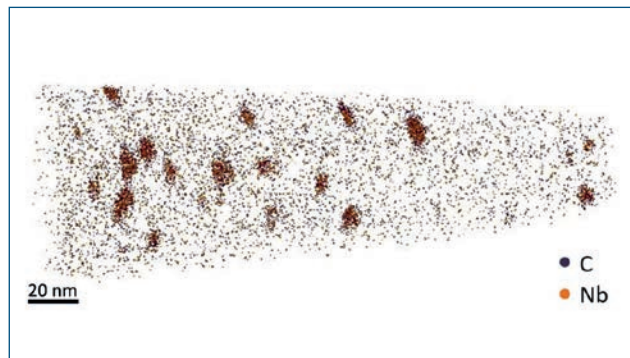
Typische nanometergroße Ausscheidung von Niob zusammen mit Kohlenstoff in einem Niob-mikrolegierten, niedriglegierten Stahl. Typical nanometer-sized precipitation of niobium together with carbon in a niobium-microalloyed low-alloy steel.