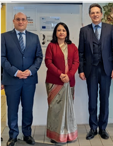
Die indische Botschafterin (Mitte) bei FuWe. The ambassador of India (center) at FuWe.