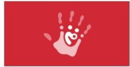
Schutzkonzepte in Organisationen