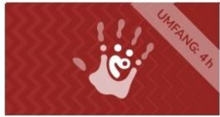
Sensibilisierung und Gewaltprävention im ehrenamtlichen Kontext