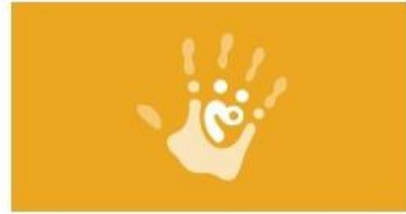
Leitungswissen Kinderschutz in Institutionen