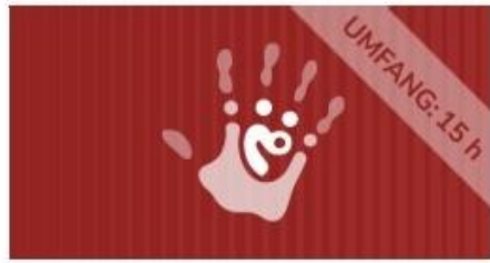
Schutzkonzepte zur Gewaltprävention im ehrenamtlichen Kontext