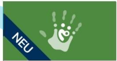
Grundkurs Kinderschutz in der Medizin